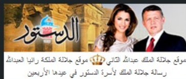
موقع جلالة الملك عبدالله الثاني، موقع جلالة الملكة رانيا العبدالله رسالة جلالة الملك لأسرة الدستور في عيدها الأربعين

وأضاف أن هناك عدة دول عربية بدأت فعليا بتوفير هذه التقنيات لتصبح أحد البنى التحتية الاساسية للاتصالات عند الانشاء لافتا الى أن دولة الإمارات العربية حازت على المرتبة الأولى بين الدول التي استخدمت هذه التقنيات اضافة الى ان دول المملكة العربية السعودية وقطر والأردن تحتل مكانة متقدمة بين الدول في هذا المضمار مؤكدا أن المنطقة تشهد طفرة في توفير هذه التكنولوجيا المتطورة والاستثمار في هذا المجال.